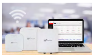
Sicheres, cloud-verwaltetes WLAN